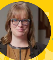
Fondatrice et présidente de Pause Ménage

Que vous soyez gestionnaire d'immeuble, entrepreneur, travailleur autonome ou parent débordé, on s'adapte à votre quotidien. Notre mission : vous faire gagner du temps, tout en maintenant un environnement à la hauteur de vos attentes et besoins.